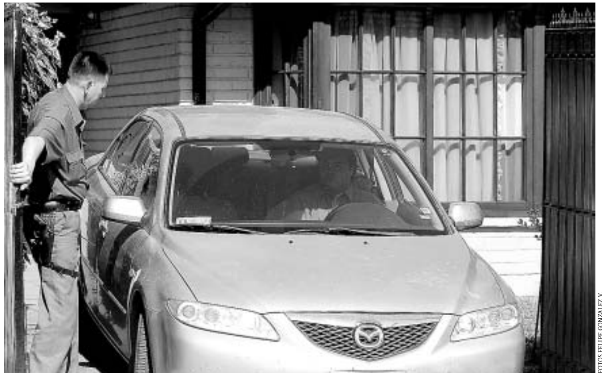
El primer objetivo de los delincuentes era plagiar y retener a la familia del empresario hasta que éste obtuviera dinero de su empresa y se las entregara. Durante la tarde, el domicilio afectado estuvo custodiado por guardias de Wagner.

de 30 años. Tras reducir a su víctima, los sujetos la obligaron a ingresar a la casa, donde capturaron al marido, al lactante de 10 meses y a la empleada doméstica. Una vez dentro obligaron a la pareja a entregar las llaves de su vehículo todo terreno. Tres de ellos lo