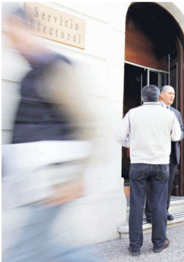
►► Al menos 391 personas confirmaron su denuncia ante el Servicio Electoral.

Von Gierke indicó que “lo que viene (en la indagación) es ubicar a las personas afectadas, hacerles pruebas caligráficas y recopilar la mayor cantidad de documentos originales que permitan hacer un peritaje documen-